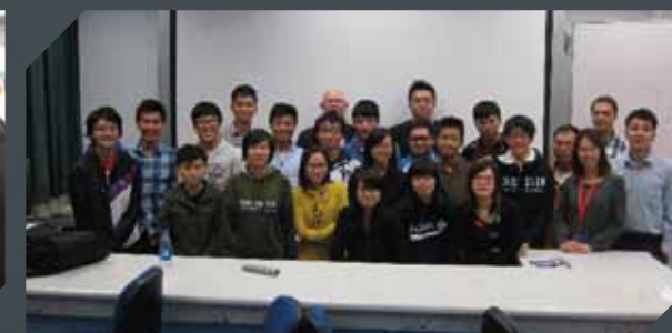
香港大學宣傳AusIMM學生分部